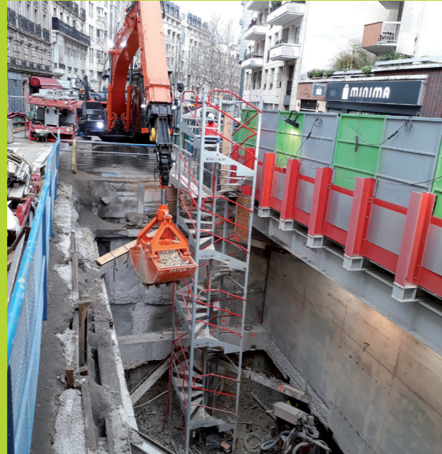
Les travaux à Pyrénées visent à créer un débouché jusqu'aux espaces souterrains du métro.

Dans le cadre de son prolongement à l'Est, la ligne 11 fait l'objet d'importants travaux de modernisation et d'adaptation rendus nécessaires par l'évolution du système d'exploitation, l'arrivée d'un nouveau matériel roulant avec passage de 4 à 5 voitures et l'augmentation attendue du nombre de voyageurs.