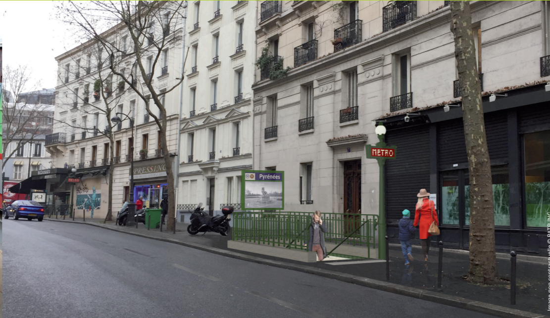
La nouvelle sortie de la station Pyrénées prévue le long de l'avenue Simon Bolivar.