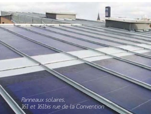
Panneaux solaires, 161 et 161bis rue de la Convention

Parallèlement, un « appel à projet » sera lancé dans notre arrondissement. L'idée étant d'associer les associations, les conseils de quartier et plus généralement tous les habitants. Du 1 er au 7 avril, vous pourrez ainsi déposer vos idées via l'urne destinée à cet effet dans le hall de la Mairie. Le développement durable, c'est l'affaire de tous !