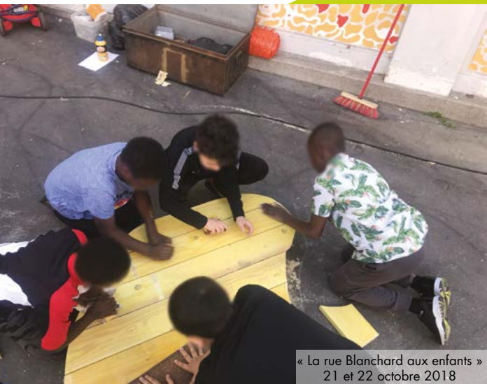
« La rue Blanchard aux enfants » 21 et 22 octobre 2018

Ces différents temps de concertation pourront aussi se concrétiser par des installations temporaires, afin de « tester » des nouveaux usages par exemple.