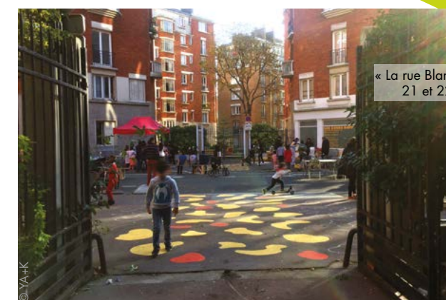
« La rue Blanchard aux enfants » 21 et 22 octobre 2018

À PARTIR DE FÉVRIER, N'HÉSITEZ PAS À VENIR VOUS RENSEIGNER à la Maison des projets de Paris Habitat angle rue Blanchard / 98, boulevard Davout, chaque mercredi après-midi. Vous pouvez également envoyer un courriel à l'adresse : coursdavout@gmail.com