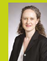
Colombe Brossel, adjointe à la Maire de Paris, chargée de la sécurité, de la prévention des quartiers populaires et de l'intégration