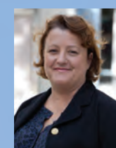
Frédérique Calandra, Maire du 20 e arrondissement

Ainsi, c'est tout un morceau de ville qui se trouvera requalifié et embelli, qui donnera vie à la ceinture verte tout en créant un nouveau lien avec les communes voisines de Montreuil et Bagnolet.