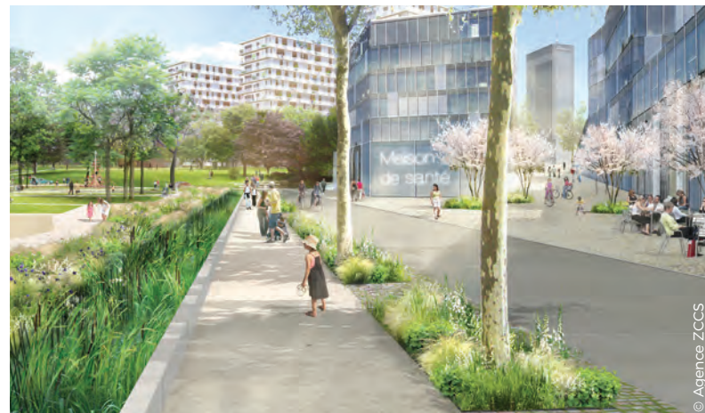
Illustration d'un aménagement possible du futur parc habité. Les grilles du centre sportif ont été remplacées par des limites végétales. Les habitants et usagers du quartier peuvent circuler librement et facilement dans le parc. En fond de perspective, on aperçoit les tours réhabilitées, les mercuriales ainsi que les nouveaux bâtiments d'activités, qui accueillent des commerces et terrasses de café en rez-de-chaussée.

L'aménagement des espaces publics sera affiné par l'aménageur, en concertation avec les habitants et les usagers.