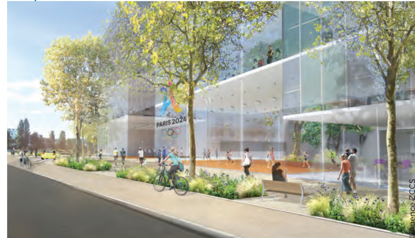
Illustration d'un aménagement possible : la piste cyclable réaménagée est bien différenciée de la chaussée, les trottoirs sont élargis et plantés, le piéton circule au pied des nouveaux bâtiments écran et peut voir en transparence les activités qui s'y déroulent. L'entrée de quartier devient plus animée et plus sécurisée.

L'avenue sera transformée en rue parisienne, desservant les logements des trois tours et les futurs bâtiments d'activités.