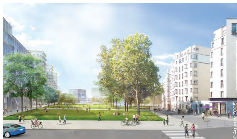
Illustration d'un aménagement possible de la future entrée de quartier depuis l'avenue de la Porte de Bagnole. La rue Louis-Lumière n'est plus une frontière, elle s'inscrit dans le prolongement du parc. Les habitants des Habitations à bon marché (HBM) profitent également du parc. Les nouveaux locaux commerciaux donnent directement sur la rue Louis-Lumière et l'avenue de la Porte de Bagnole et participent à l'animation de l'entrée de quartier.