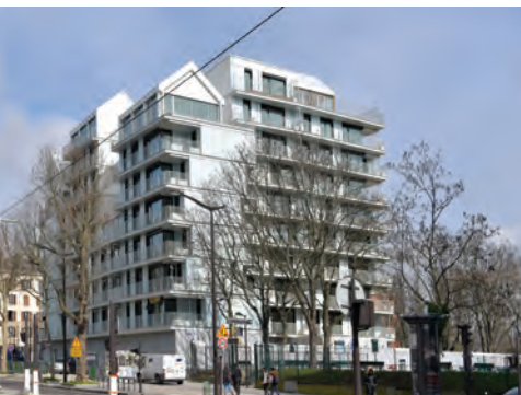
La livraison des logements du 134 boulevard Davout (20 e ) s'inscrit dans un programme ambitieux de réalisation d'une offre renouvelée et diversifiée.