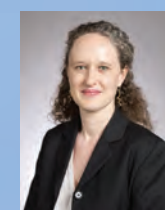
Colombe Brossel, adjointe à la Maire de Paris, chargée de la sécurité, de la prévention, des quartiers populaires et de l'intégration