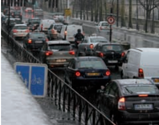
7 UN DOSSIER : VOIES SUR BERGES (P.6)