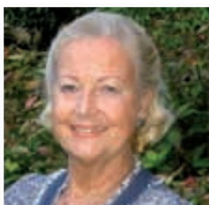
Martine Aurillac, député de Paris, vice-présidente de la commission des Affaires étrangères