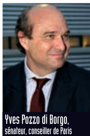
Yves Pozzo di Borgo, sénateur, conseiller de Paris