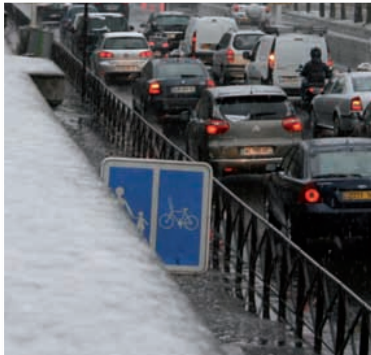
La réalité des Parisiens et des Franciliens : 4000 véhicules par heure sur les

Le 25 novembre, les élus Franciliens UMP dénoncent le projet. « Les voies sur berges sont des axes structurants d'intérêt général. Ils concernent la région dans son ensemble. » Patrick DEVEDJIAN, président du Conseil Général des Hauts de Seine, accuse Bertrand DELANOË de n'avoir été informé officiellement du projet que le 15 octobre et de n'avoir jamais impliqué le Conseil Général des Hauts de Seine dans une quelconque concertation avant mi novembre. 7