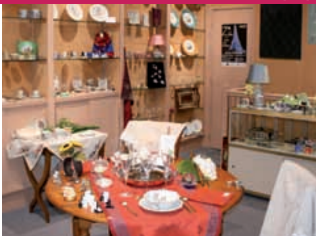
7 UN M TIER D'ART : LE CHAMBERLAIN (P.14)