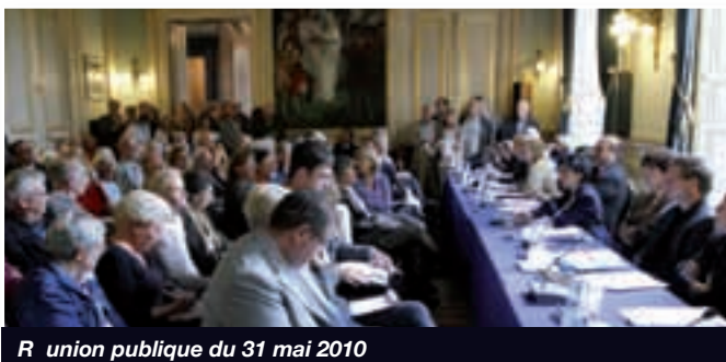
Réunion publique du 31 mai 2010

Sous le Pont de l'Alma , un marché aux fleurs et un jardin botanique.