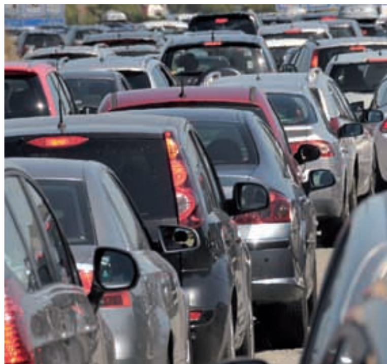
Le boulevard périphérique et les voies parallèles sont encombrés toute heure

Le 22 novembre , Rachida DATI adresse un courrier à Bertrand DELANOË, lui demandant de revoir son projet étant donné le résultat de la consultation et les nombreuses contradictions.