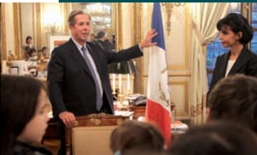
7 ARRIVÉ : LES CM2 DU 7 E AU CONSEIL CONSTITUTIONNEL (P.12)