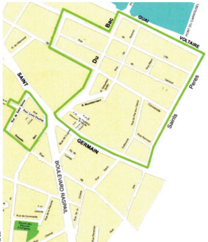
Secteur des OCNA réalisées du 4 au 6 octobre 2010.

➔ Opérations en faveur du développement durable et oppositions à toutes les manifestations dégradantes pour l'environnement.