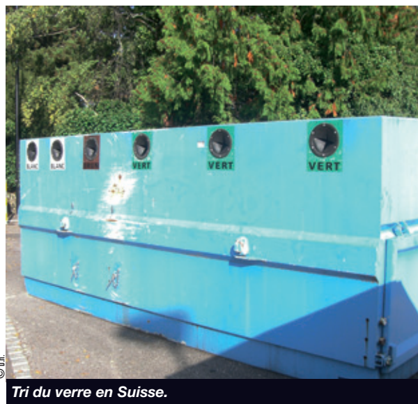
Tri du verre en Suisse.

La Ville de Besançon vient également de se lancer dans ce système.