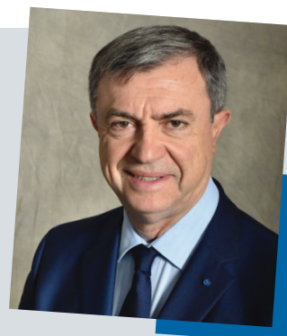
Jean-Pierre LECOQ Maire du 6 e arrondissement, Conseiller régional d'Île-de-France

Je vous invite à participer nombreux à cet appel à candidatures.