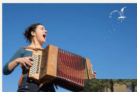
LA BOUILLONNANTE

PIONNIER DANS LE DOMAINE DES ARTS DE LA RUE , le Printemps des rues nous propose une 22 ème édition surprenante, révoltée et émouvante, donnant la parole à des artistes au cœur du débat public. Sous l'étendard des prises de conscience, de position, de l'engagement humain et citoyen mais aussi de la convivialité !