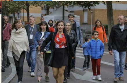
LES FUGACES