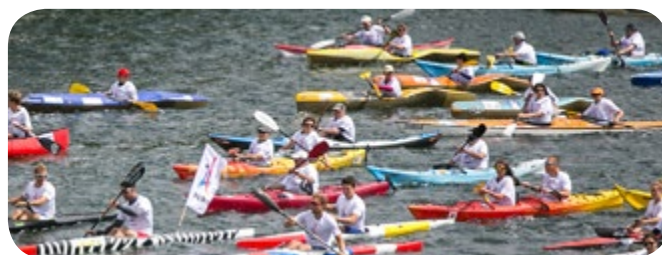
Les 23 et 24 juin, le cœur de Paris s'est métamorphosé en terrain de sport géant à l'occasion des Journées olympiques .

Le 13 septembre 2017, Paris a été désigné comme ville organisatrice des Jeux Olympiques et Paralympiques 2024 . Ce succès porte en son cœur la volonté de Paris de réaliser les premiers Jeux inclusifs, responsables et durables de l'Histoire, laissant un héritage au bénéfice des Parisien-ne-s, des visiteurs et des visiteuses. En ce sens, les chantiers lancés dès 2017 visent l'accès au sport au plus grand nombre, la construction d'une ville végétalisée et apaisée, ainsi que la valorisation de l'économie circulaire et de l'innovation sociale.