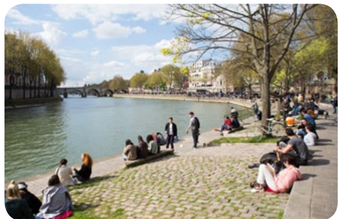
Les quais bas de la rive droite de la Seine sont réservés aux piéton-ne-s et aux circulations douces.

La Ville valorise l'eau comme une richesse qu'il faut rendre accessible à tous les Parisien-ne-s. En 2017, 27 nouvelles fontaines d'eau potable ont été installées dans la capitale et la baignade dans le bassin de la Villette (19 e ) a été inaugurée en juillet, remportant un vif succès.