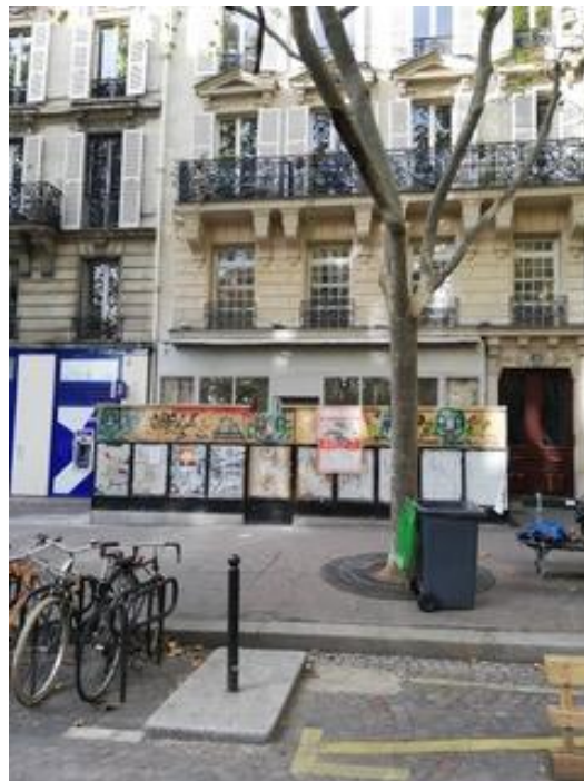
Aujourd'hui en travaux

A l'inverse, l'hôtel Rochechouart a été refait à l'identique. Le gérant a eu le souci de préserver cet héritage.