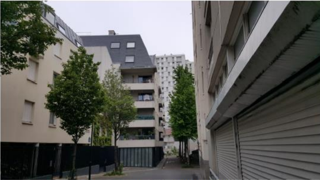
L'antenne n'est pas visible depuis ce point de vue