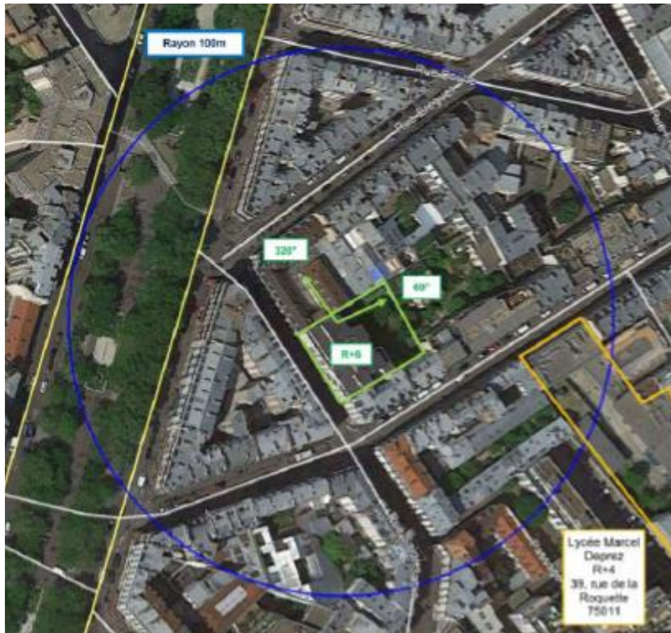
Adresses des établissements particuliers dont l'emprise est située à moins de 100 m et estimation du champ maximum reçu des antennes à faisceaux fixes dans chacun d'entre eux