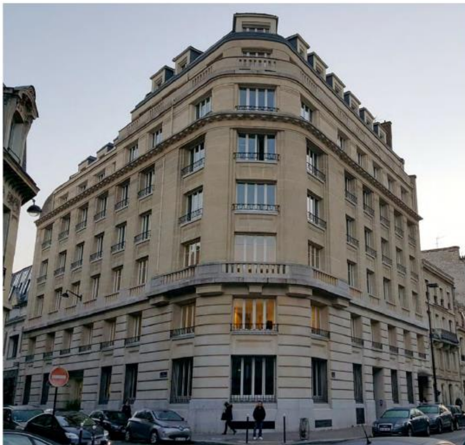
L'antenne n'est pas visible depuis ce point de vue