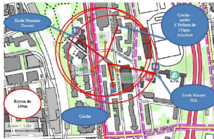
Estimation des antennes à faisceaux orientables

Les estimations réalisées tiennent compte de la contribution de l'ensemble des antennes à faisceaux orientables (5G) de Bouygues Telecom présentées dans le présent document.