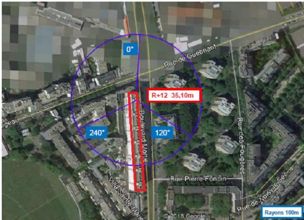
Aucun établissement particulier dans un rayon de 100 m autour des antennes