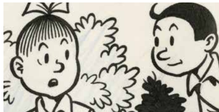
Jusqu'au 27 février 2021