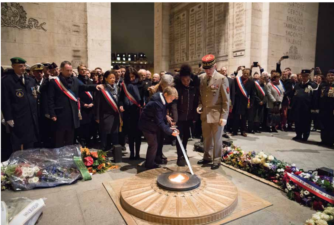
Le ravivage de la Flamme par des élèves accompagnés par le Général Bruno Dary, la Maire de Paris, les élus de Paris et les autorités militaires (2019)