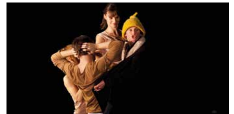
Première quinzaine de Février

36, avenue Matignon www.hubertybreyne.com