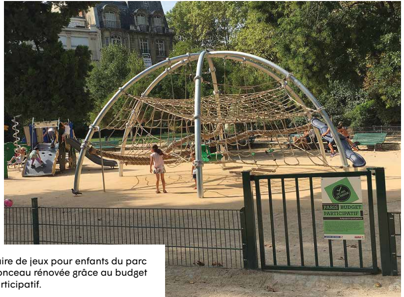
L'aire de jeux pour enfants du parc Monceau rénovée grâce au budget participatif.

La date limite de dépôt des projets est fixée au 28 février.