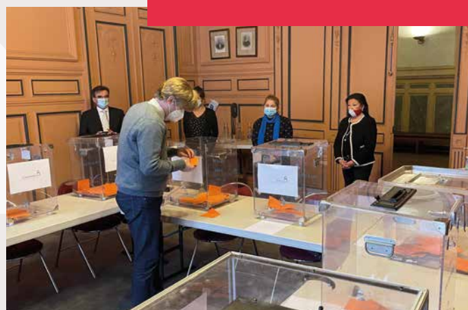
Tirage au sort des nouveaux membres des Conseils de Quartier, sous contrôle d'huissier.