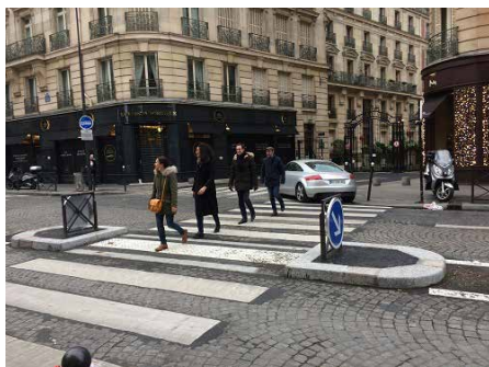
Les traversées piétonnes du 223 Faubourg Saint-Honoré sécurisées grâce au budget participatif.

4 autres projets sont en phase de travaux, et 5 sont en cours d'études.