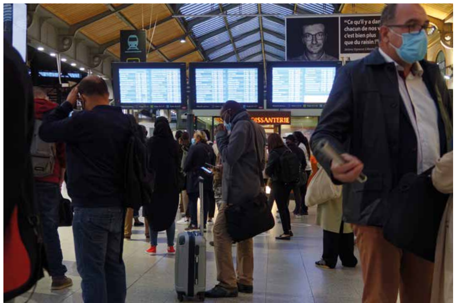
Saint-Lazare : deuxième gare d'Europe en terme de trafic

Le projet d'Est-Ouest Liaison Express (EOLE) va prolonger le RER E de 13 stations vers l'Ouest. Des travaux impressionnants notamment dans le 8 e arrondissement de Paris, pour devenir la ligne la plus interconnectée d'Île-de-France et améliorer sensiblement le quotidien.