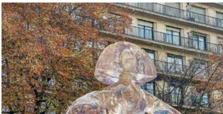
Jusqu'au 30 mars 2021