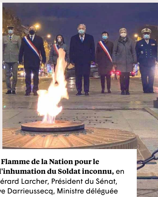
Ravivage de la Flamme de la Nation pour le centenaire de l'inhumation du Soldat inconnu , en présence de Gérard Larcher, Président du Sénat, et de Geneviève Darrieussecq, Ministre déléguée auprès de la Ministre des Armées.