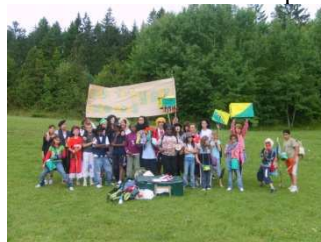
Grande journée à thème « tournoi Football et multi-sport »