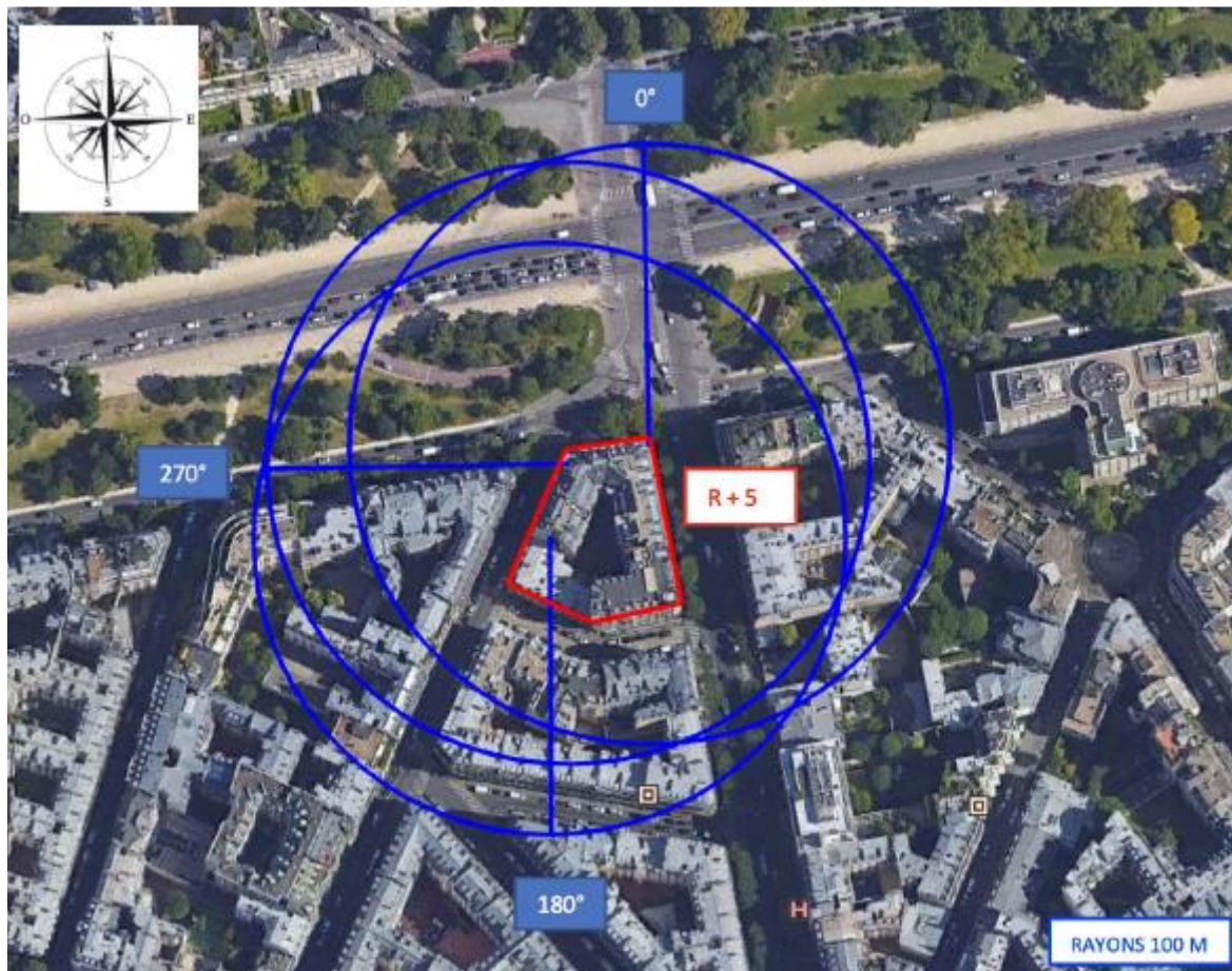
Aucun établissement particulier dans un rayon de 100 m autour des antennes