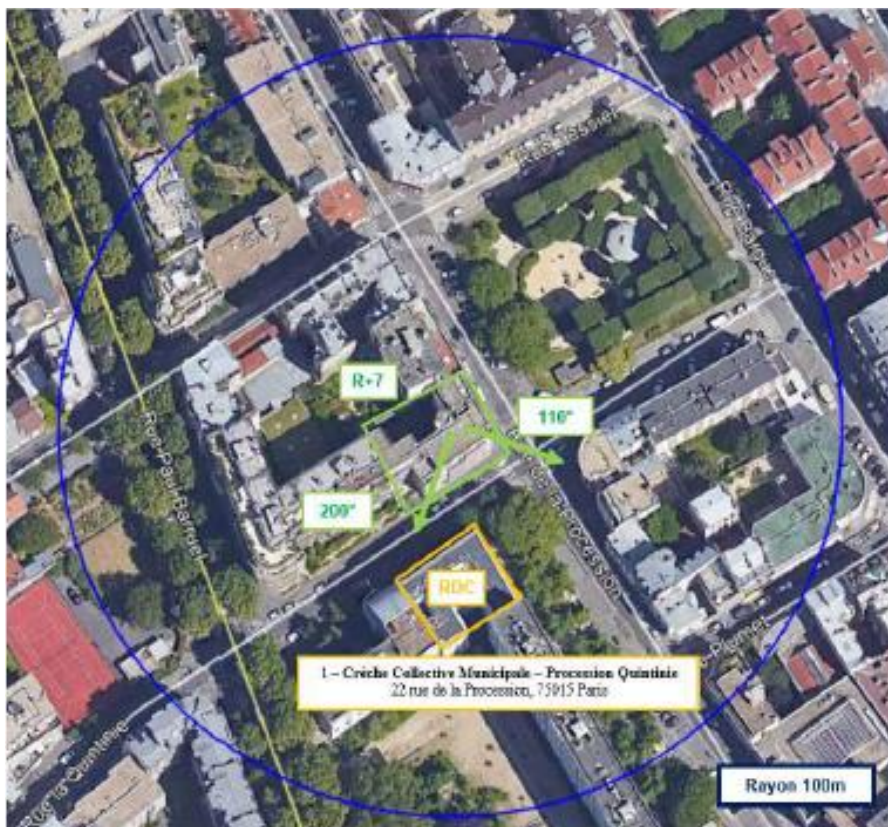
Adresses des établissements particuliers dont l'emprise est située à moins de 100 m et estimation du champ maximum reçu des antennes à faisceaux fixes dans chacun d'entre eux