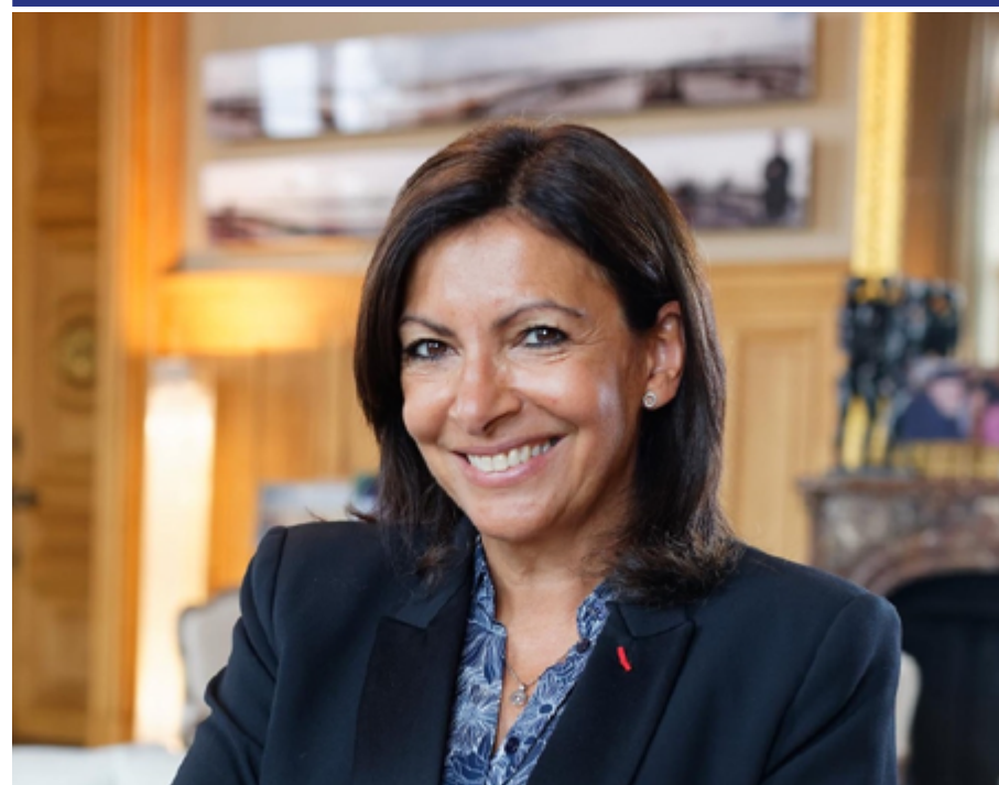
ANNE HIDALGO Maire de Paris

Paris Centre, c'est le cœur historique de notre capitale. Là où tout a commencé. Aujourd'hui, 100 000 Parisiennes et Parisiens y habitent, y ont fondé leurs familles et bâti leurs projets de vie. C'est un lieu unique, mondialement admiré pour sa richesse patrimoniale, architecturale, pour la joie de ses rues et de ses terrasses, pour la beauté de ses musées, de ses jardins, des bords de Seine.