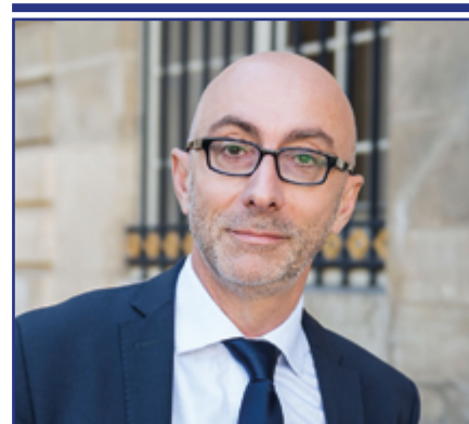
BRUNO RICARD Directeur des Archives nationales

Les Grands Boulevards, ceinturant une partie du centre historique de la capitale, concentrent à eux seuls, avec ses théâtres, ses salles de concert, ses cinémas et son Opéra Comique, une tradition toujours vivante liée à la création et au divertissement. En octobre 2018, l'ouverture de notre librairie sur 500 m 2 , en face du métro Grands Boulevards, s'inscrit dans cette lignée: être accessible à tous, attiser sans cesse la curiosité, offrir de nouvelles réflexions, des émotions et porter haut le verbe, l'écriture et le texte! »