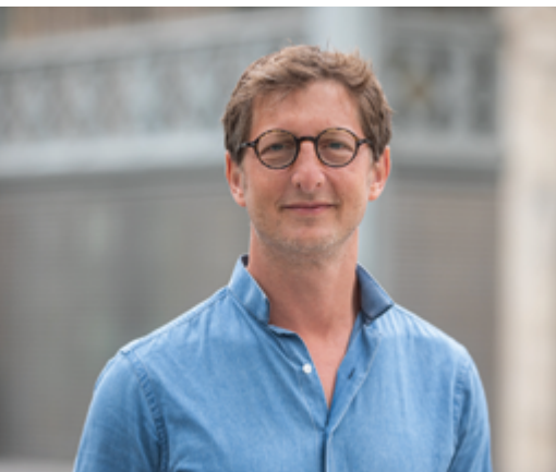
ARIEL WEIL Maire de Paris Centre

Une trentaine d'Habitantes et Habitants vous racontent leur Paris Centre