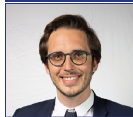
PACÔME RUPIN Député de Paris et élu d'opposition de Paris Centre

fin à l'exode des familles, stopper la fermeture de classes et la transformation de résidences principales en résidences secondaires ou locations de courte durée, je plaide pour que Paris Centre retrouve son lustre et rouvre ses grands axes dans la concertation et le respect des libertés. »