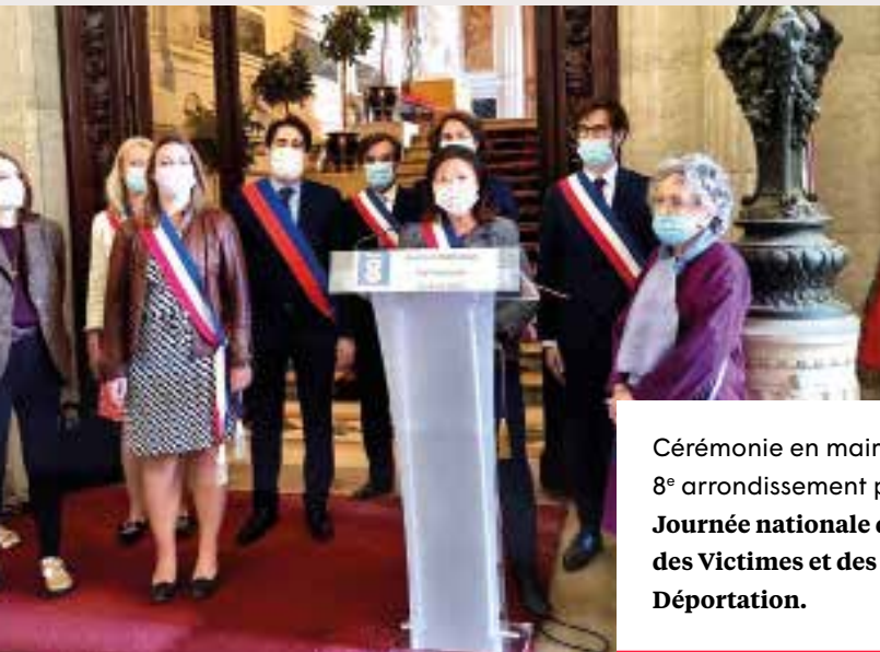
Cérémonie en mairie du 8 e arrondissement pour la Journée nationale du Souvenir des Victimes et des Héros de la Déportation .