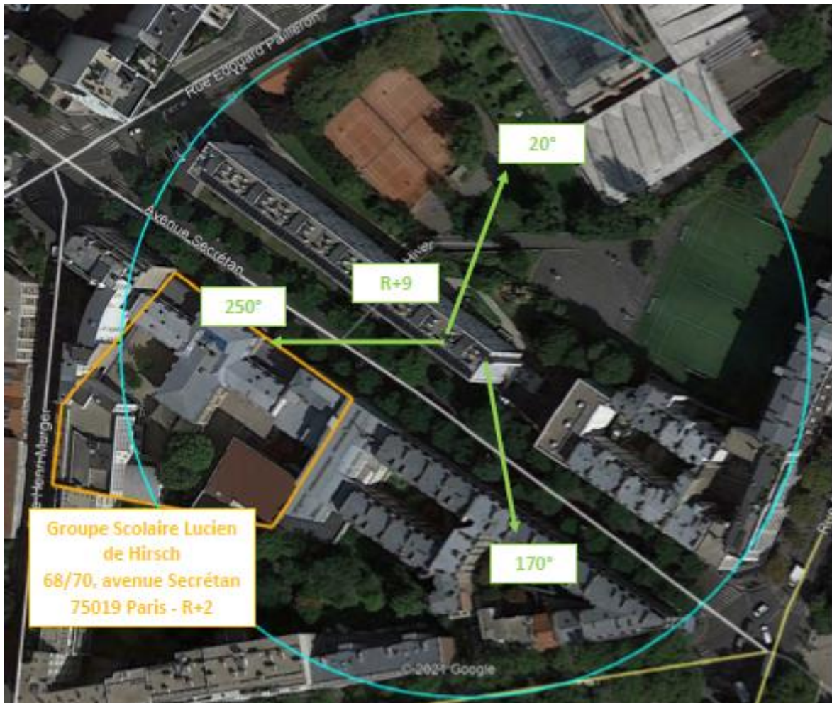
Adresses des établissements particuliers dont l'emprise est située à moins de 100 m et estimation du champ maximum reçu des antennes à faisceaux fixes dans chacun d'entre eux