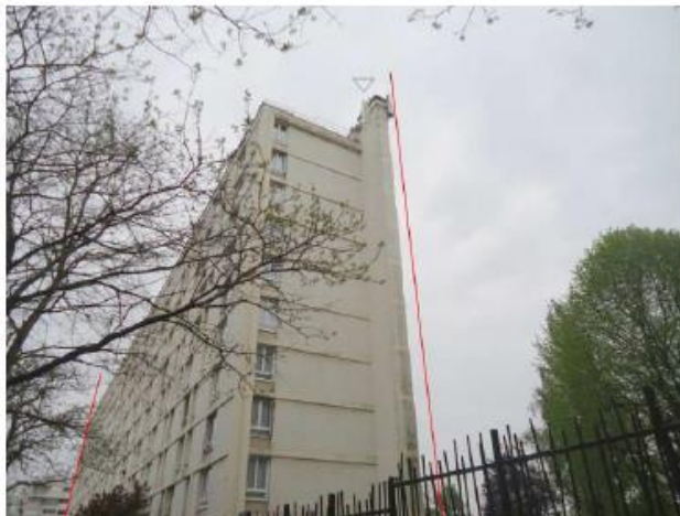
Pas de changement visuel