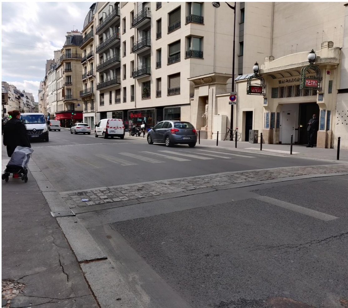
Création d'un passage piéton surélevé – rue de Sèvres