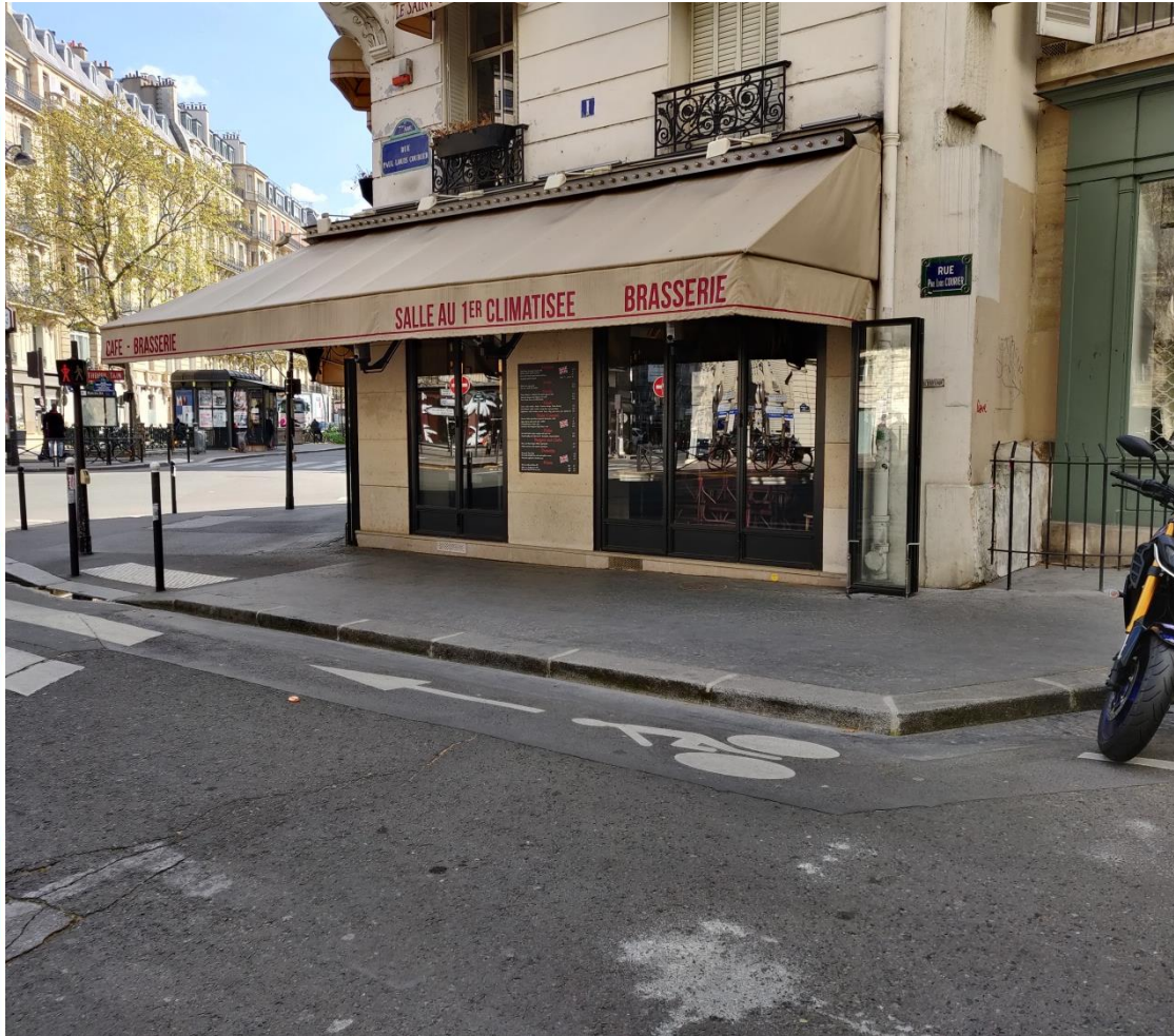
Élargissement de trottoir – rue Paul-Louis Courier

Désencombrer l'espace public et rendre de la place aux piétons