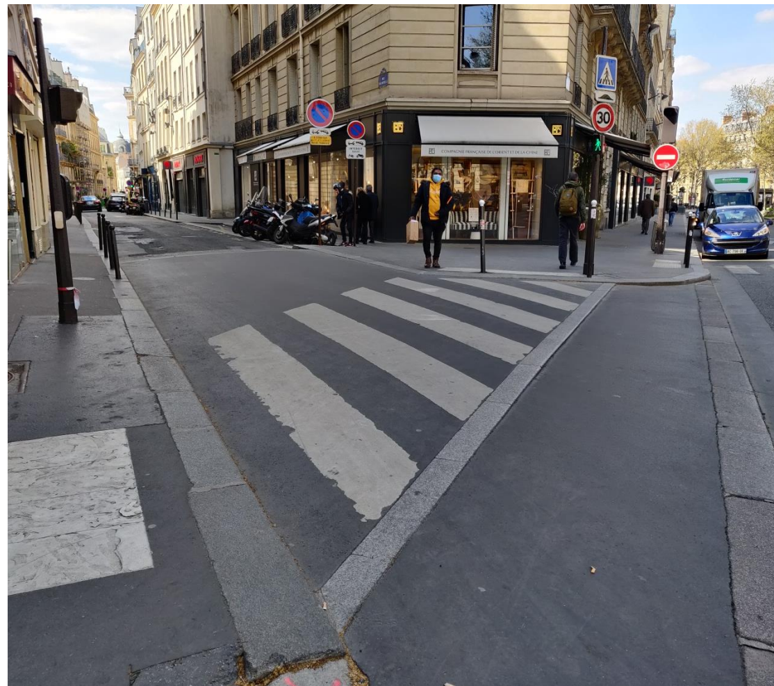
Création d'un passage piéton surélevé – rue de Grenelle