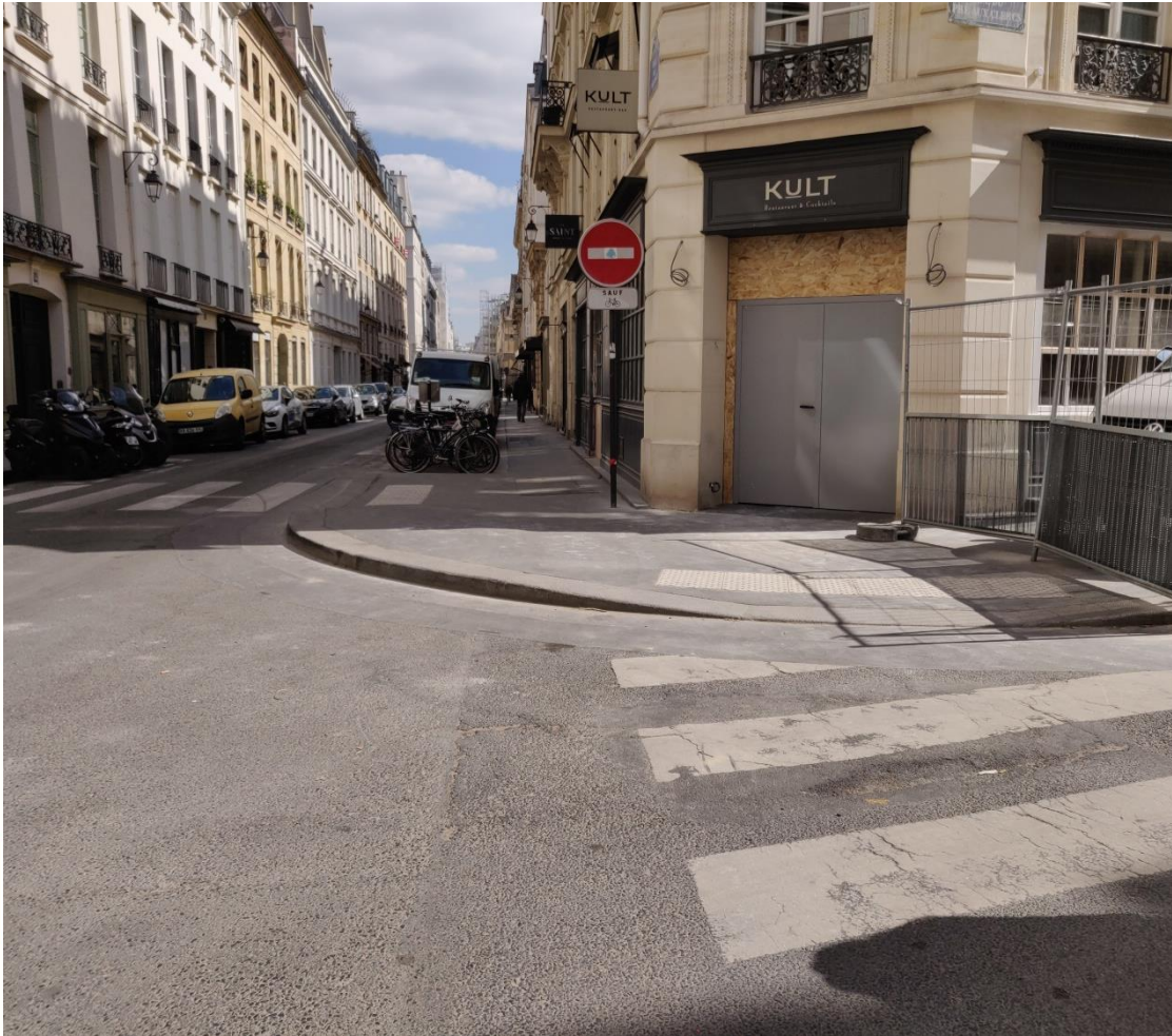
Élargissement de trottoir au carrefour rue du Pré-aux-Clercs et rue de l'Université

Désencombrer l'espace public et rendre de la place aux piétons