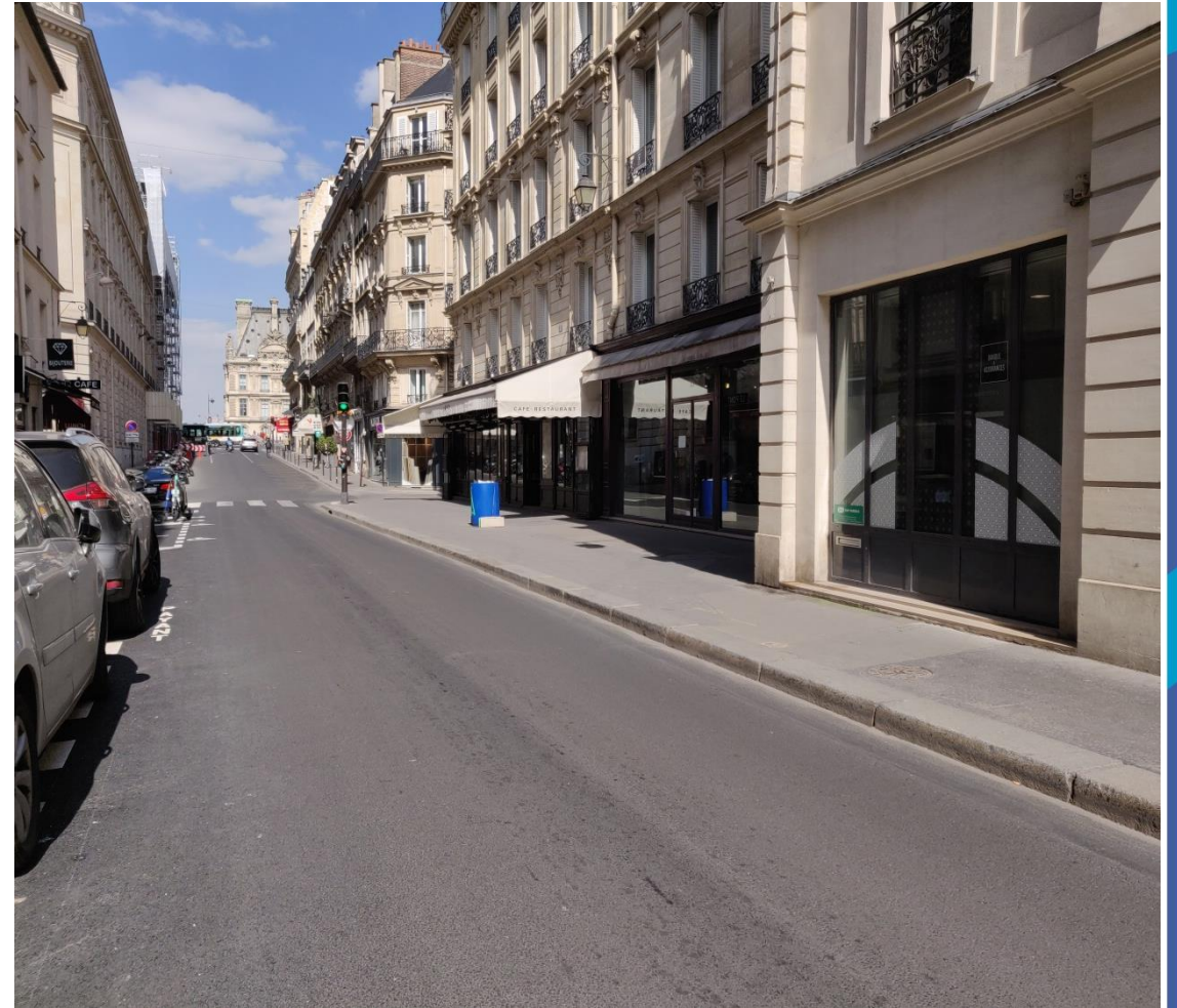
Élargissement de trottoir – rue du Bac