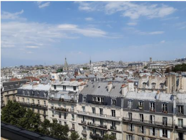
Azimut S0 :