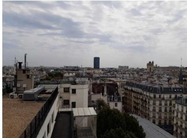
Azimut S1 :