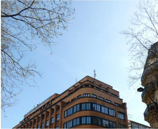
Photo du site vue depuis la rue après travaux