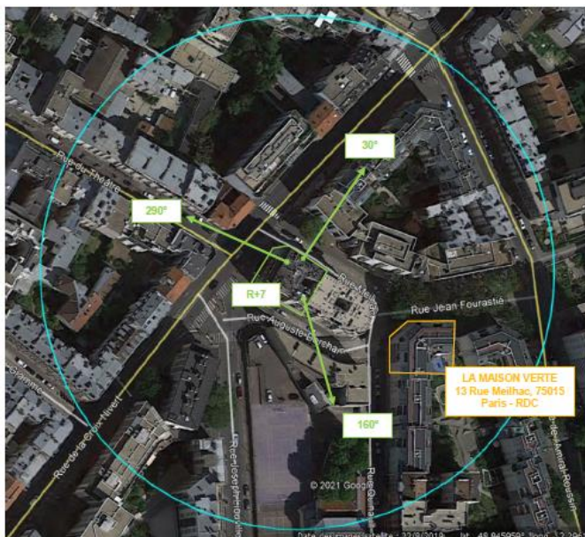
Adresses des établissements particuliers dont l'emprise est située à moins de 100 m et estimation du champ maximum reçu des antennes à faisceaux orientables dans chacun d'entre eux