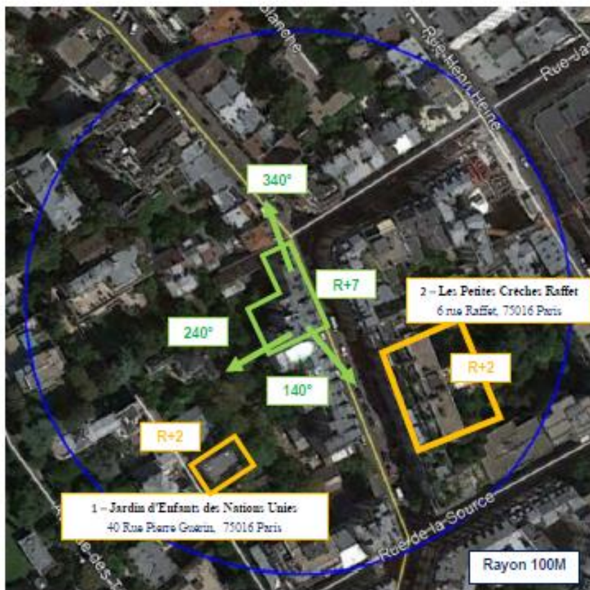
Adresses des établissements particuliers dont l'emprise est située à moins de 100 m et estimation du champ maximum reçu des antennes à faisceaux fixes dans chacun d'entre eux