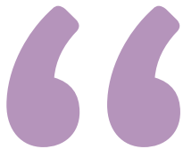
Nizar Belghith Maire du quartier Vallée de Fécamp

“La Médiathèque Hélène Berr, le musée de l'immigration ou la promenade plantée, Bel-Air Sud ne manque pas d'atouts ! La rénovation de la cité scolaire Paul Valéry et l'aménagement des places Félix Éboué et Sans-nom seront autant de leviers pour créer des continuités piétonnes et mieux relier les différents lieux du quartier.”