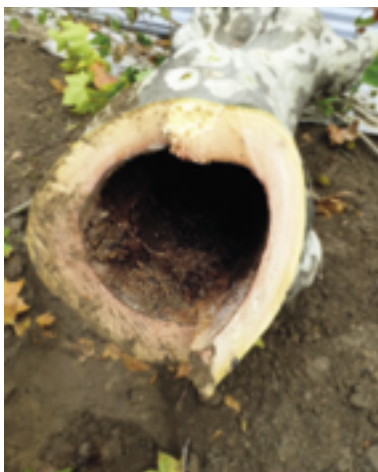
Au 182 de l'avenue Daumesnil, cet arbre, pourtant feuillu et sain de l'extérieur, était complètement rongé de l'intérieur, menaçant une chute dans l'espace public.

Une étude "arbre et climat" est actuellement menée afin d'adapter le choix des espèces d'arbres à l'évolution du climat, pour qu'ils souffrent moins lors des épisodes de sécheresse, qu'ils vivent mieux et plus longtemps. Diversifier les espèces est également parfois souhaitable, afin de mieux protéger les arbres contre les maladies.