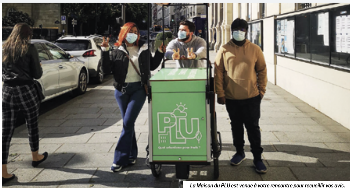
La Maison du PLU est venue à votre rencontre pour recueillir vos avis.

MISE EN PRATIQUE DU PROJET D'AMÉNAGEMENT À L'ÉCHELLE DES QUARTIERS ET DES RUES