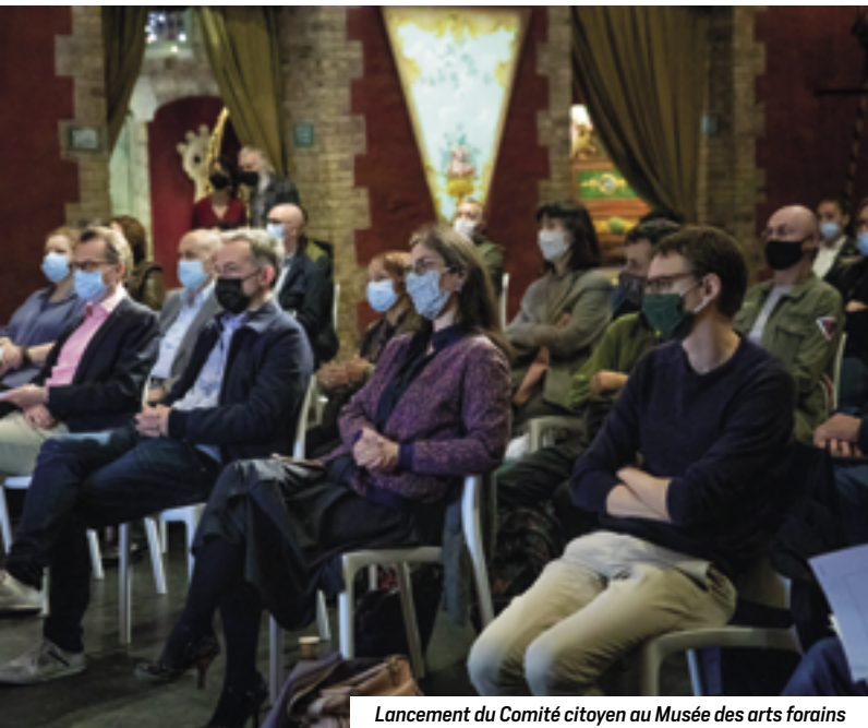
Lancement du Comité citoyen au Musée des arts forains