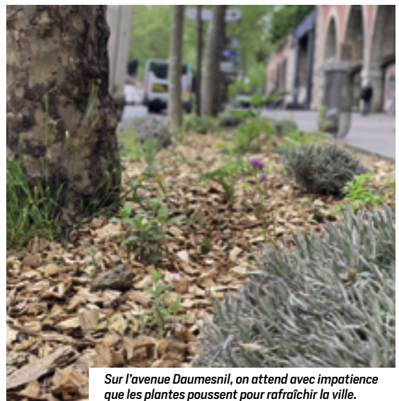
Sur l'avenue Daumesnil, on attend avec impatience que les plantes poussent pour rafraîchir la ville.

Cela vient évidemment améliorer la qualité de vie pour les riverain·es, les commerçant·es et les passant·es, mais c'est également une plus-value écologique : en ajoutant un axe de verdure qui relie la Petite Ceinture, la Coulée Verte, les squares de proximité et le Bois de Vincennes, on permet à la faune et à la flore de se déplacer, de se nourrir et de se reproduire.