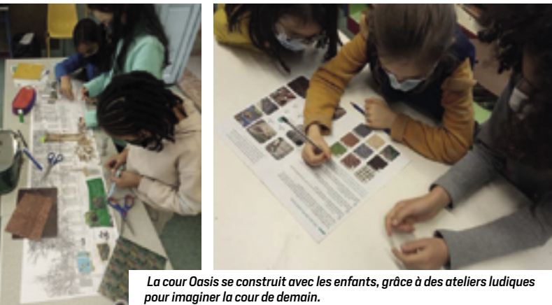
La cour Oasis se construit avec les enfants, grâce à des ateliers ludiques pour imaginer la cour de demain.