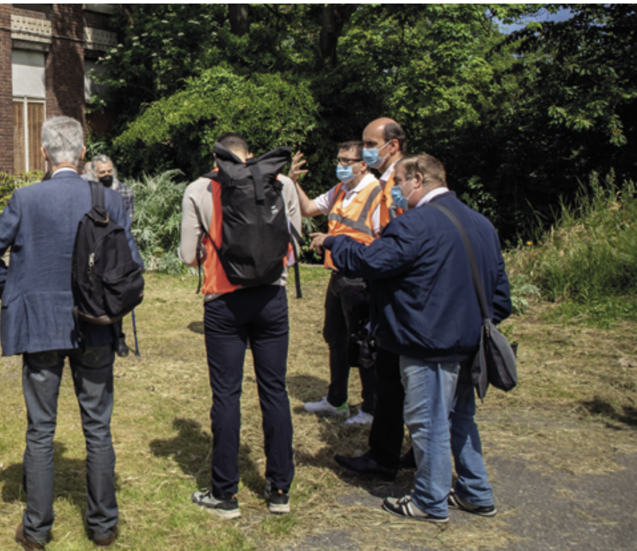
Le Comité citoyen a arpenté la ZAC Bercy-Charenton le 29 mai pour pouvoir rendre un avis étayé au sujet de la refonte du projet.