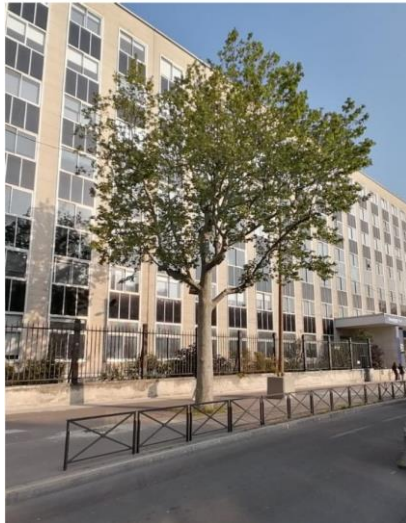
Photo du site vue depuis la rue après travaux Inchangée