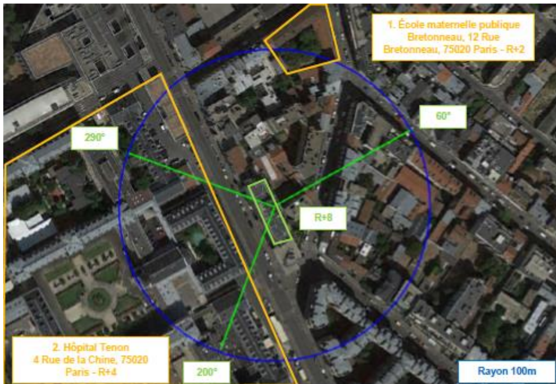
Adresses des établissements particuliers dont l'emprise est située à moins de 100 m et estimation du champ maximum reçu des antennes à faisceaux fixes dans chacun d'entre eux