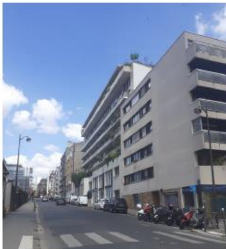
Le projet n'est pas visible depuis ce point de vue