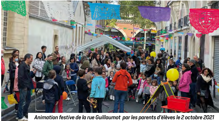
Animation festive de la rue Guillaumot par les parents d'élèves le 2 octobre 2021

Depuis septembre 2021, le 12 e compte deux nouvelles rues piétonnes devant la maternelle Armand Rousseau et aux abords des écoles Bouton-Diderot. La rue de Reuilly devant l'élémentaire et le collège Oeben a également été totalement reconfigurée pour apaiser les entrées et sorties d'école.