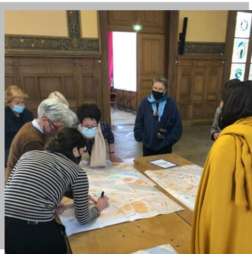
Séance de cartographie à la mairie du 12 e

Les « Lombardines en marche » documentaire, réalisé par « A places égales », qui explique la méthodologie des marches exploratoires. Visionner le film