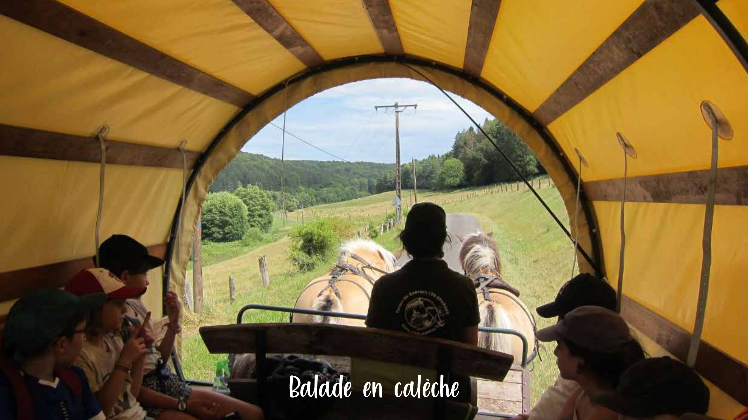
Balade en calèche