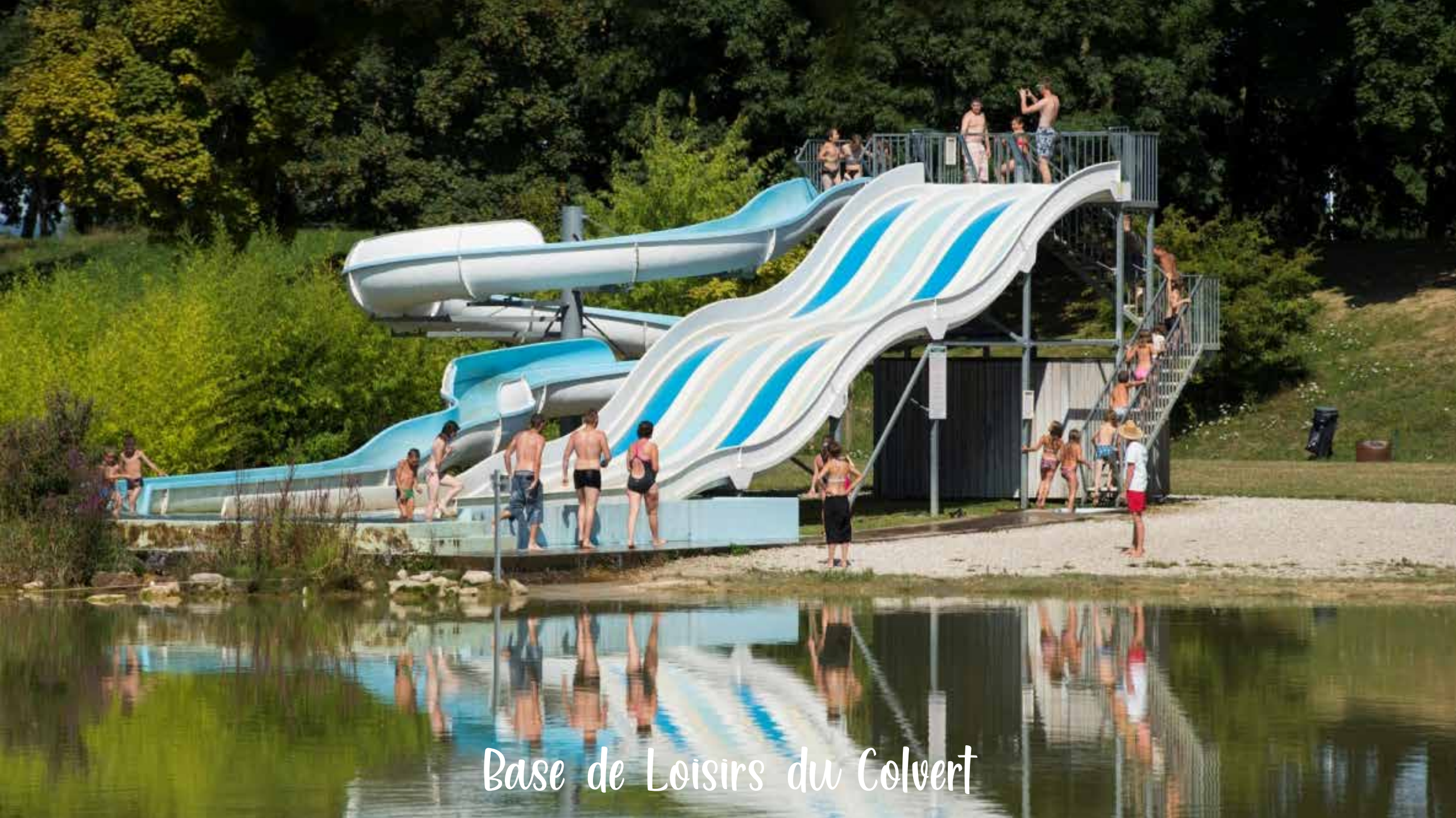
Base de Loisirs du Colvert