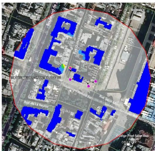
Fond de carte (photo aérienne). Logiciel de simulation Cellerity, éditeur Orange Labs

Azimut 354° Pour l'antenne à faisceau fixe d'azimut 354, le niveau maximal calculé est compris entre 4 et 5 V/m. La hauteur correspondante est de 22.50 m.