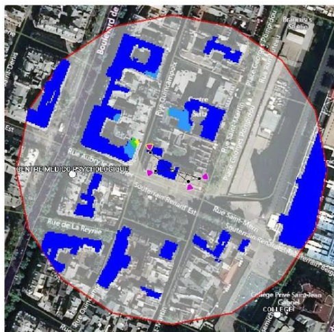
Fond de carte (photo aérienne). Logiciel de simulation Cellerity, éditeur Orange Labs

Azimut 354° Pour l'antenne à faisceaux orientables d'azimut 354, le niveau maximal calculé est compris entre 4 et 5 V/m. La hauteur correspondante est de 22.50 m.