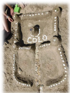
« De l'Art du traditionnel

Château de sable au plus contemporain Land'Art, tout aussi éphémère...»