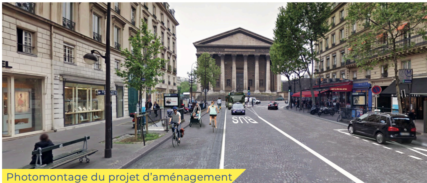
Photomontage du projet d'aménagement