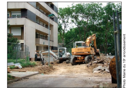
Le quartier en devenir

Au moment où les engins de chantier reviennent, le plan et les photos présentés en pages centrales vous permettront également d'imaginer ce à quoi ressemblera votre quartier dans quelques mois.