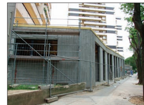
Extension des tours E et F

Travaux à démarrer début 2008. Cette réalisation nécessitera le transport et la scolarisation des enfants dans d'autres écoles pendant les travaux. Elle fera l'objet d'une information spécifique.