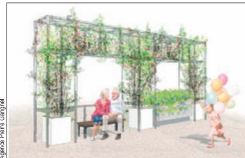
Autour de l'aire de jeux, pourquoi pas des pergolas ornées de plantes grimpantes ?

Certains aspects techniques doivent encore être étudiés, notamment le raccordement au parvis situé entre la galerie Mercure et la dalle haute. Ce parvis pourrait être réaménagé.