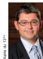
Jérôme Coumet Maire du 13 ème Arrondissement

Nous nous engageons aujourd'hui dans une opération de large envergure pour le quartier mais soyez assurés que ma détermination reste entière.