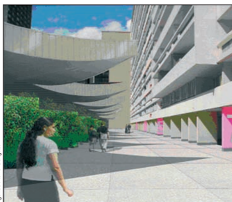
Un exemple d'aménagement

Les allées situées entre la galerie Mercure et les entrées des immeubles Rome et Grenoble sont peu agréables. Pierre Gangnet suggère plusieurs aménagements : plantes sur les façades arrières des commerces, meilleure signalisation des halls d'immeubles et amélioration de l'éclairage la nuit.