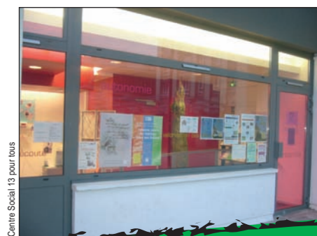
Centre Social 13 pour tous

le 16 janvier 2009 à partir de 19 heures pour une soirée café-jeux