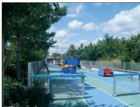
Une aire de jeux à Paris

Après l'ouverture des deux crèches en construction, la crèche actuelle sera démolie. L'espace libéré pourrait accueillir une aire de jeux pour jeunes enfants. Cet équipement comporterait un sol souple, particulièrement adapté aux petits. Géré et entretenu par la Ville de Paris, il ouvrirait aux horaires des jardins publics.