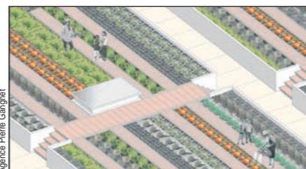
La proposition de Pierre Gangnet

La terrasse située à l'arrière de l'immeuble Squaw Valley est inutilisée. Elle bénéficie d'une orientation sud / ouest propice à la culture et ferait le bonheur des jardiniers confirmés ou ... en herbe. Les plantations pousseraient dans des jardinières agrandies.