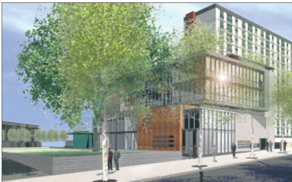
Le futur bâtiment vu depuis l'avenue de la Porte de Vanves

Le futur bâtiment comprendra un centre social, une halte-crèche, un relais assistantes maternelles et des locaux pour des professions libérales.