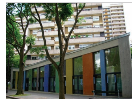
Le Centre d'Accueil Psycho-Pédagogique et le service PMI