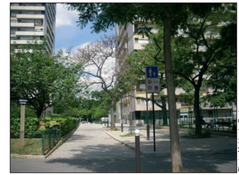
La rue le long de la crèche