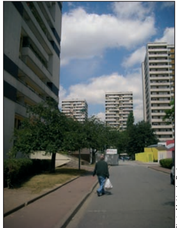
La rue qui dessert le groupe scolaire

Votre sélection deviendra officielle après validation du Conseil d'Arrondissement et approbation du Conseil de Paris.