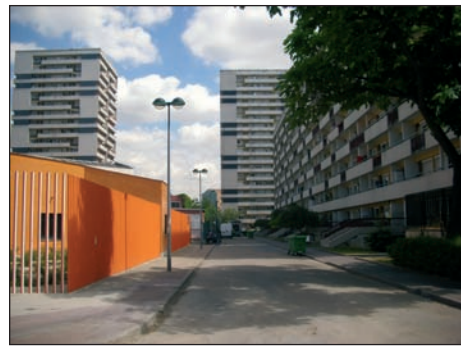
La rue qui longe la barre Q