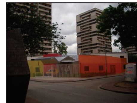
Le centre d'animation