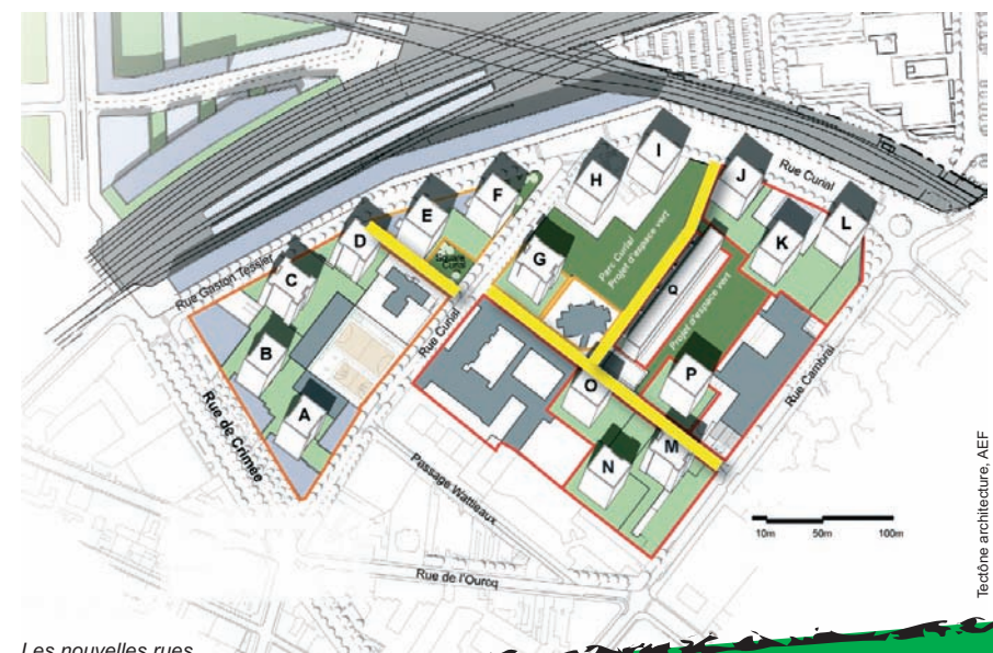
Les nouvelles rues