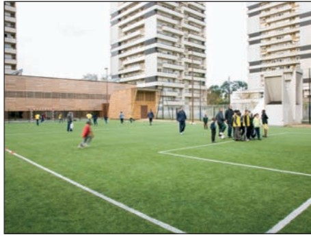
Une découverte réussie

Des portes largement ouvertes pour tous les âges et tous les goûts.