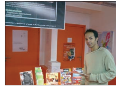
Un accueil avec le sourire

L'Antenne - Jeunes leur apporte des réponses en souplesse. Ici, pas de formalités ni de rendez-vous : on vient en toute liberté, les services sont gratuits et on peut garder l'anonymat. L'implantation de l'antenne au coeur du quartier conforte cette approche. Comme le rappelle Frédéric "La proximité est le ciment de la relation".