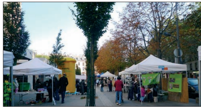
La propreté en fête