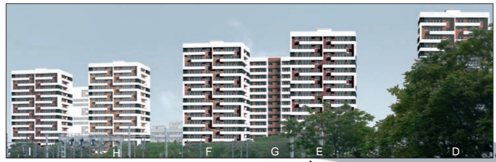
Les tours D E F G H I après travaux

La "résidentialisation" de certaines tours est déjà achevée. Celle des autres est programmée. Tous les logements bénéficieront de travaux de réfection et d'isolation thermique. Ils commenceront par les tours A, D, E, F, G, H, I au 1 er trimestre 2010.