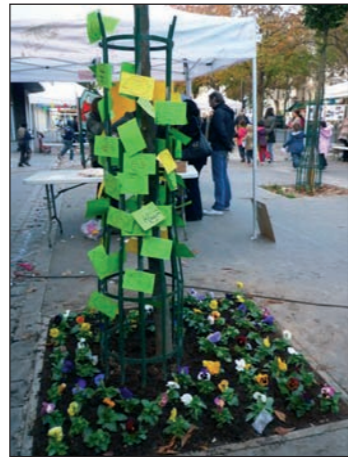
Des "plantations" rappelant le respect dû aux arbres

La Régie de quartier a organisé avec succès la dernière édition de "Faites de la propreté !" le 14 octobre dernier. Cette manifestation, soutenue par la Mairie de Paris et la Mairie du 19 ème , s'est déroulée sur la placette du 234 rue de Crimée. Les associations et les services de la Ville ont accueilli les habitants sur des stands. Au programme : animations, informations et jeux. Du tri sélectif au recyclage créatif en passant par des plantations symboliques, la journée a été bien remplie. De nombreux visiteurs ont participé à cette action. Un succès pour les organisateurs... et pour les enfants qui ont paradé dans le quartier au slogan de "On ne jette rien par terre, on met tout à la poubelle !"