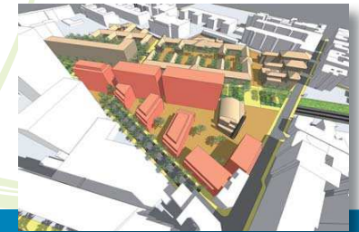
2 - Une disposition régulière