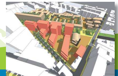
3 - Des bâtiments étagés en peigne