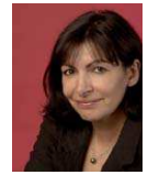
Anne Hidalgo, première adjointe au maire de Paris, chargée de l'urbanisme et de l'architecture

2014 Livraison prévisionnelle du Centre Culturel et de la crèche Travaux de la promenade plantée