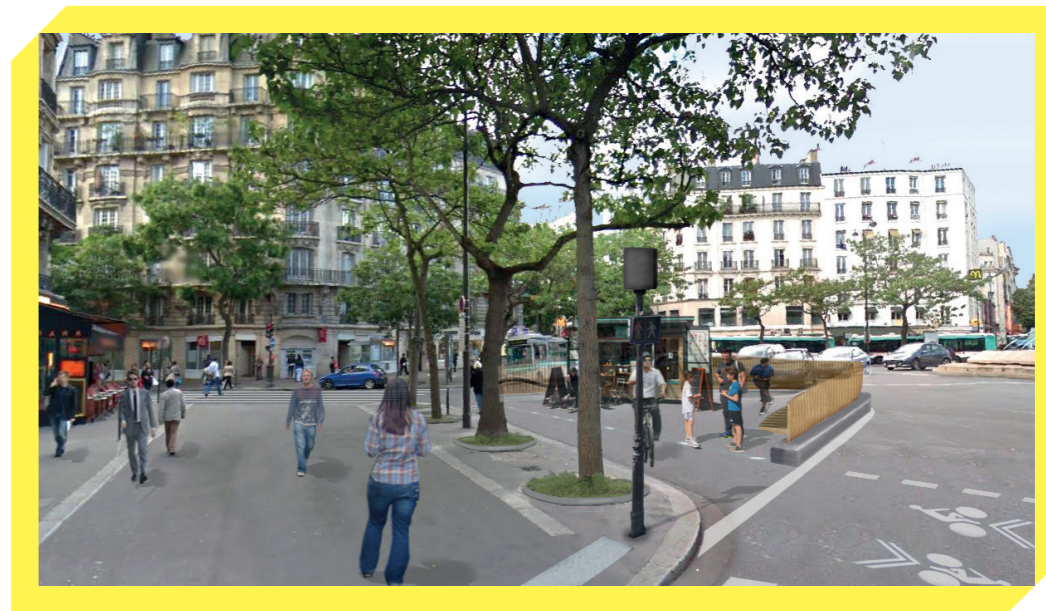
Le projet de réaménagement de la place Gambetta