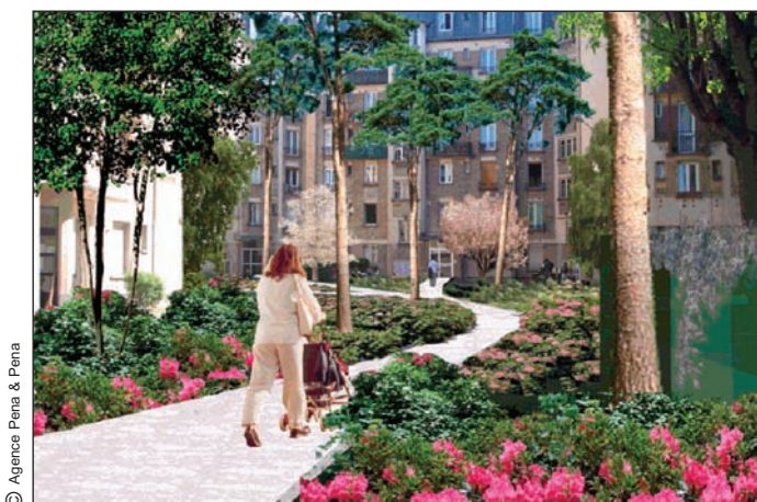
Projet - Vue des cours intérieures