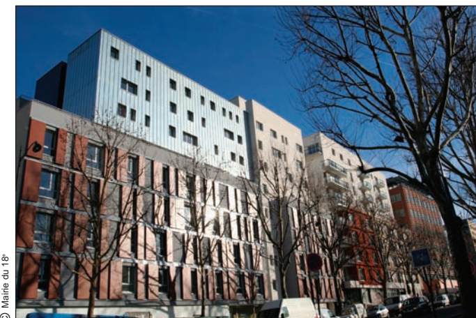
Avenue de la Porte des Poissonniers - Vue d'ensemble

Ce quartier se développera encore dans quelques années avec l'aménagement, au 80 boulevard Ney, des 2 hectares de terrains appartenant au Ministère de la Défense.