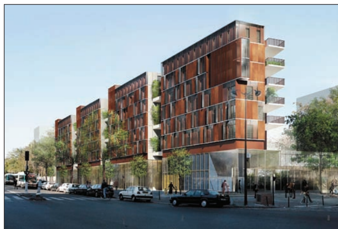
Esquisse projet - Perspective de la Porte Montmartre

école maternelle. En outre, un immeuble d'activités sera édifié le long du périphérique, à la place de la tour démolie. Les dernières réalisations devraient avoir démarré en 2014.