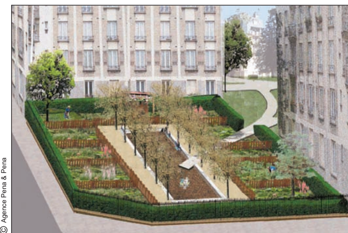
Projet - Vue des jardins partagés

Au programme également : des plantations dans les cours intérieures, la création de jardins partagés et l'aménagement d'un local associatif.