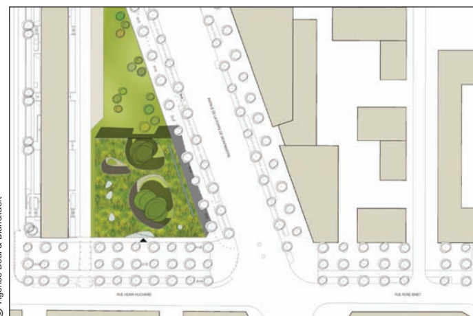
Projet crèche - Plan masse

Les travaux de restructuration de l'îlot Binet démarreront par la construction d'une crèche de 60 berceaux sur l'avenue de la Porte Montmartre, à l'angle du mail Henri Huchard.