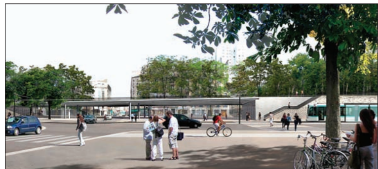
Mairie de Paris DVD - Devillers Cornejo Arcadis Colebia Aggod