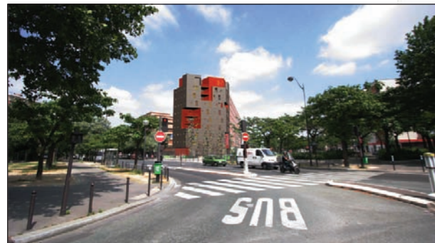
Le futur immeuble

Après la livraison du nouvel immeuble avenue Claude Régaud, une résidence de 54 studios pour étudiants sera créée Place du Docteur Yersin (angle des rues Claude Régaud et Joseph Bédier). Les logements, adaptés aux personnes à mobilité réduite, comporteront kitchenette et salle de bain. Ce bâtiment sera performant (isolation, consommation énergétique, ...). Le chantier démarrera fin 2008 et durera 18 mois.