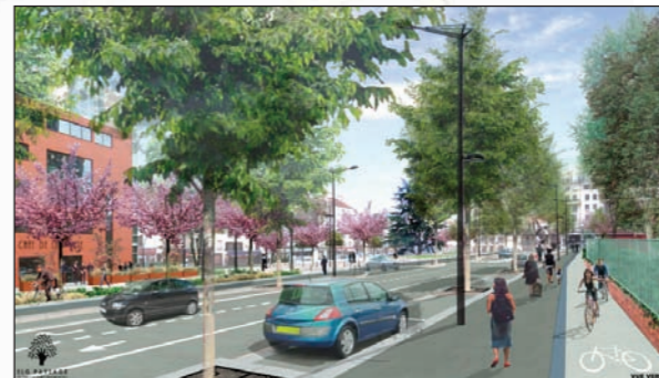
Vue depuis Paris et le périphérique vers Ivry-Sur-Seine

La commune d'Ivry va restructurer la Porte d'Ivry : amélioration et développement des circulations piétonnes et cyclistes, meilleure desserte des commerces, stationnement payant, arbres... Les travaux dureront de septembre 2008 à début 2010, sans modification des circulations et accès aux commerces. Une réunion publique Paris / Ivry aura lieu fin 2008-début 2009.