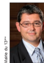
Jérôme Coumet Maire du 13 e Arrondissement

Nous allons vivre ensemble une grande aventure qui, je le pense, contribuera à améliorer durablement votre quartier Bédier-Porte d'Ivry.