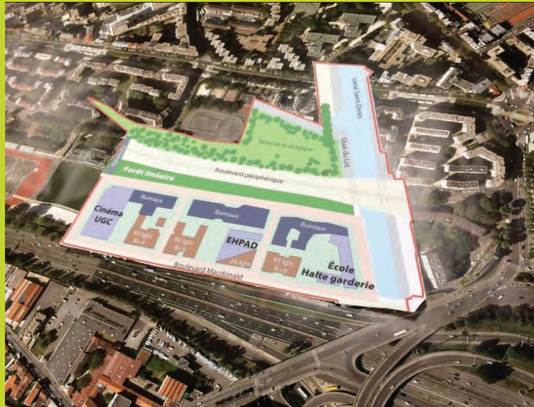
Plan de la ZAC Claude Bernard à l'échelle de Python-Duvernois, un outil pour réfléchir à la transformation du quartier.