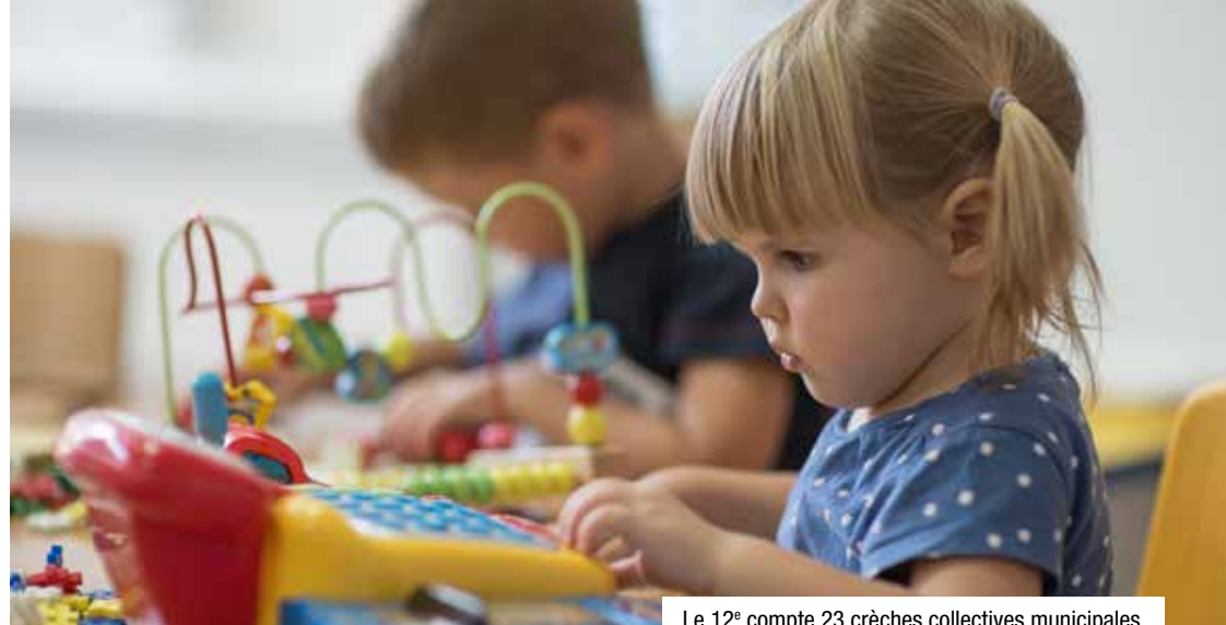
Le 12 e compte 23 crèches collectives municipales.