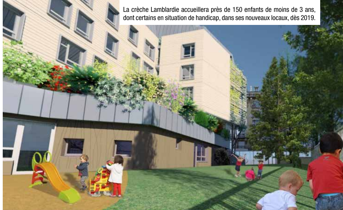
La crèche Lamblardie accueillera près de 150 enfants de moins de 3 ans, dont certains en situation de handicap, dans ses nouveaux locaux, dès 2019.

La Caisse Nationale d'Allocations Familiales a fixé une révision des tarifs au 1 er janvier de chaque année, sur la base des revenus perçus par les familles durant l'année N-2. Cette révision qui concerne l'ensemble des familles permet une actualisation annuelle des ressources perçues et un nouveau calcul des participations familiales correspondantes.