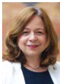
Catherine BARATTI-ELBAZ Maire du 12 e arrondissement de Paris