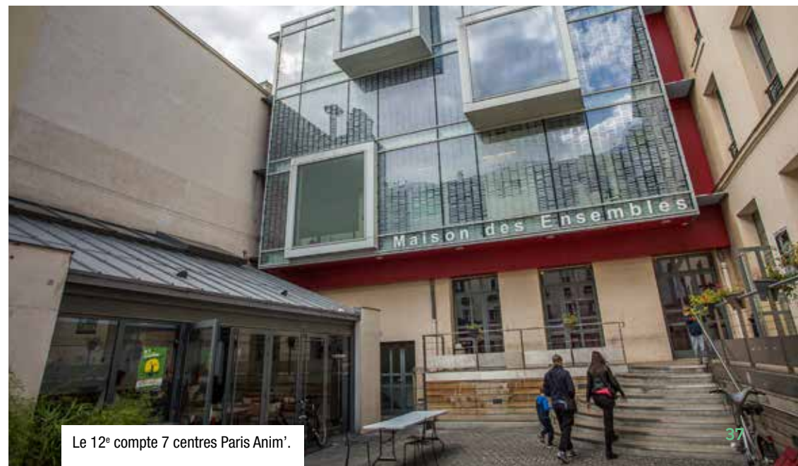
Le 12 e compte 7 centres Paris Anim'.