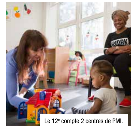
Le 12 e compte 2 centres de PMI.