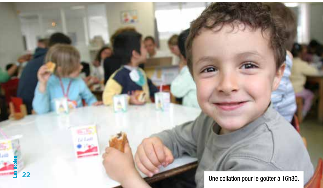
Une collation pour le goûter à 16h30.

Dès la fin de l'année scolaire et jusqu'à la rentrée des classes, les centres de loisirs d'été répartis dans tout Paris accueillent à la journée les enfants parisiens. Une occasion pour eux de profiter d'une multitude d'activités (sorties, espaces Nature, dans le Bois de Vincennes...)