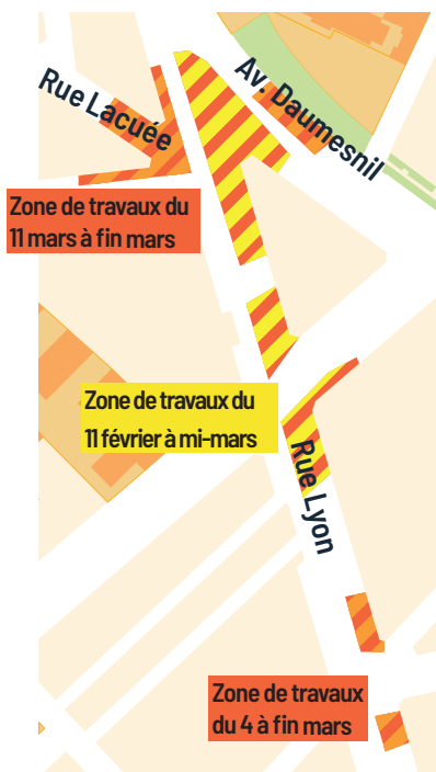
Situation des emprises de chantier

Du 11 mars à fin mars, la circulation générale de la rue de Lyon sera déviée par la rue Traversière.