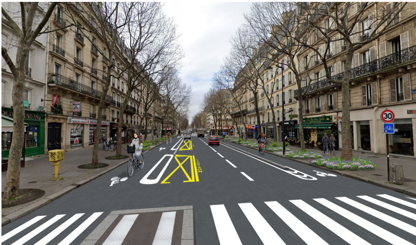
Photomontage du projet

Les travaux sont découpés en deux zones successives pour réduire l'impact occasionné. À chaque changement de zone, les plans de circulation et de stationnement sont modifiés. La circulation de tous les véhicules à l'exception des secours est notamment interdite dans chaque zone neutralisée. Les tronçons compris entre la rue de Lyon et le quai de la Râpée sont fermés à la circulation générale certaines nuits, afin de permettre l'installation ou le déplacement des zones en travaux.