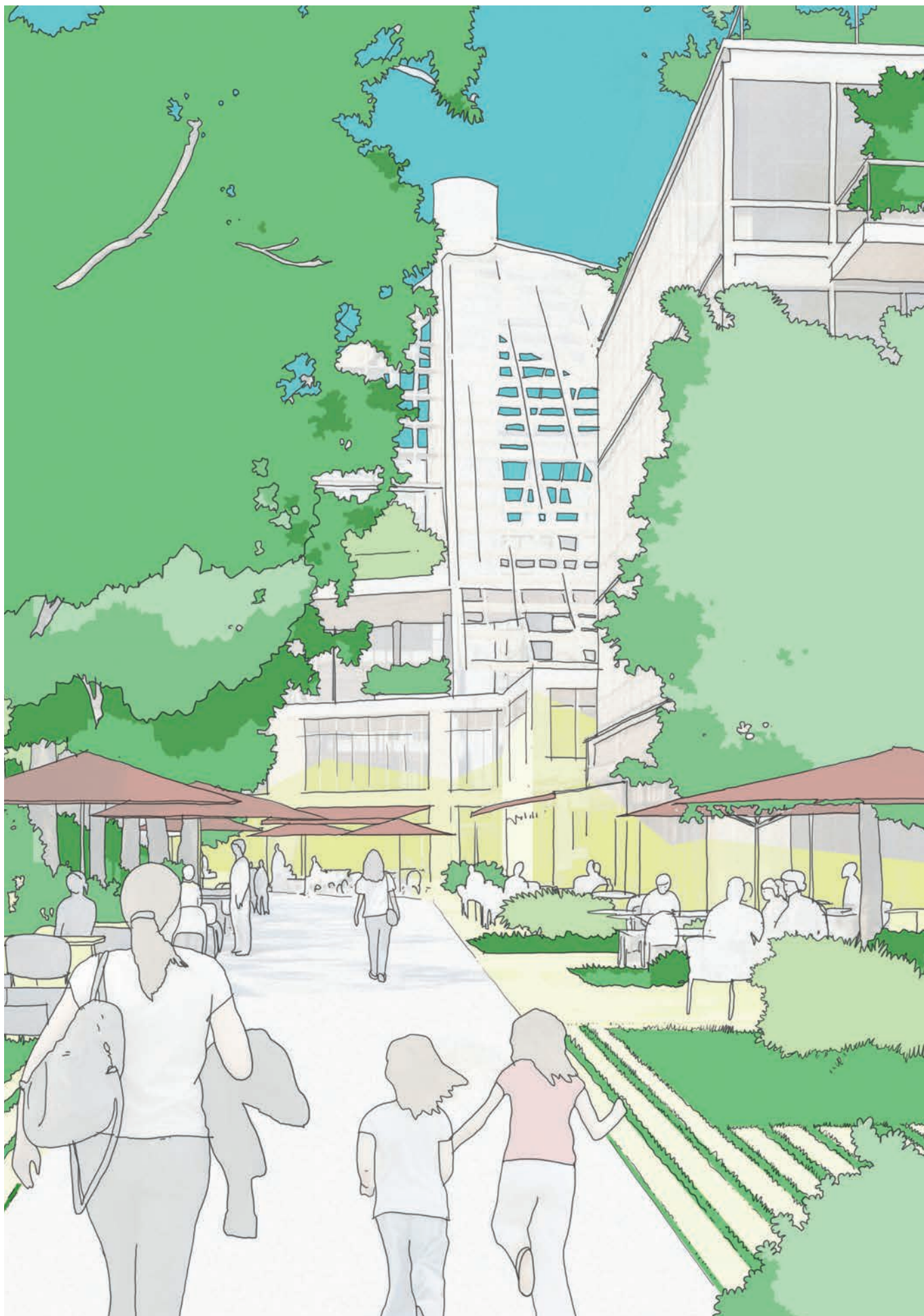
Croquis de l'intention architecturale pour la future entrée du site Aquaboulevard, rue Pierre Avia