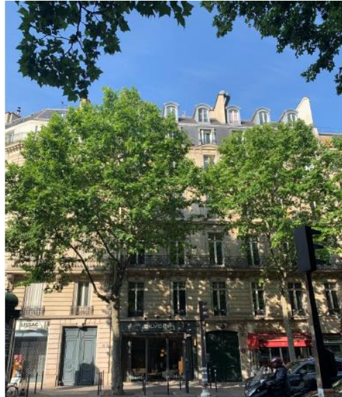
PAS D'IMPACT VISUEL DEPUIS LA RUE